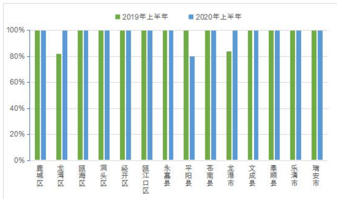
图 3 各县（市、区）污水处理厂达标率变化情况