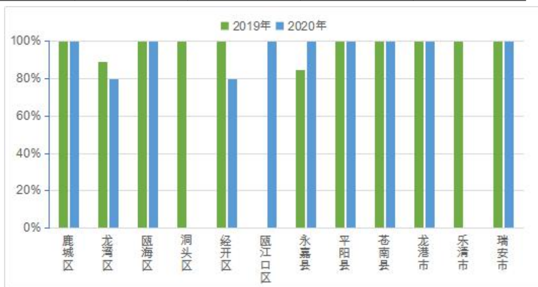
图 1 各县（市、区）工业废水重点排污单位达标率变化情况