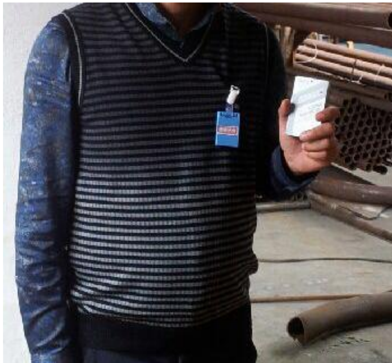
图 6-8 辐射工作人员佩戴个人剂量计，手持个人剂量报警仪