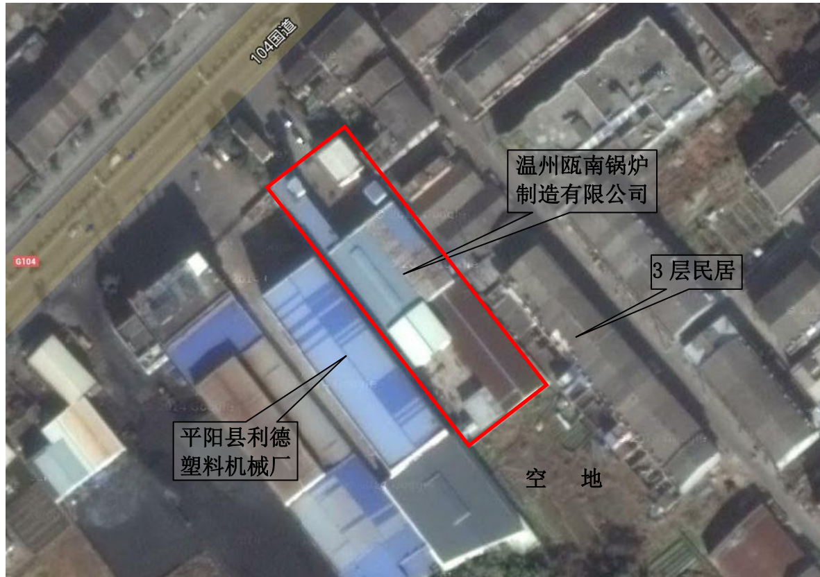
2-1 温州瓯南锅炉制造有限公司地理位置示意图