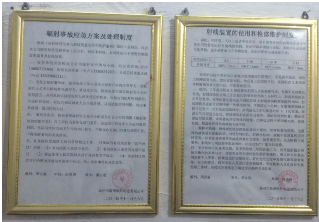
图 6-7 规章制度上墙明示