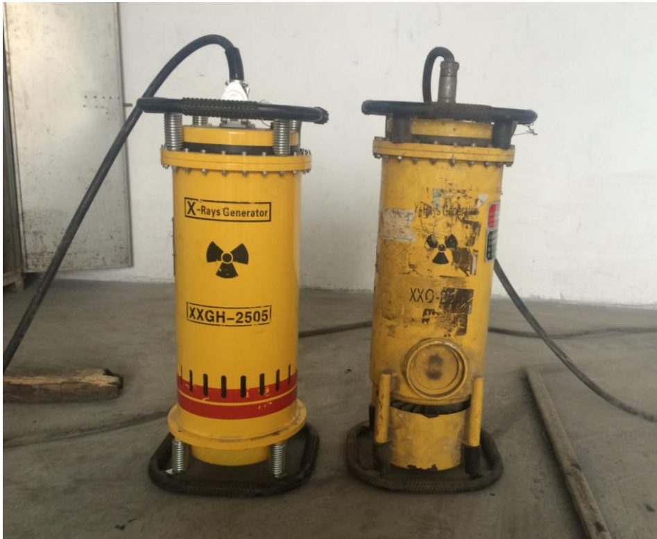
图 6-1 工业X 射线探伤机