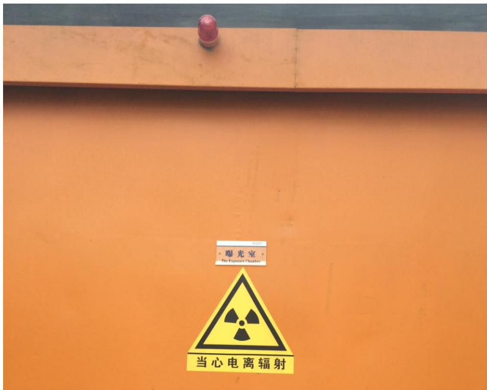
图 6-2 探伤室防护门、电离辐射标志及警示灯