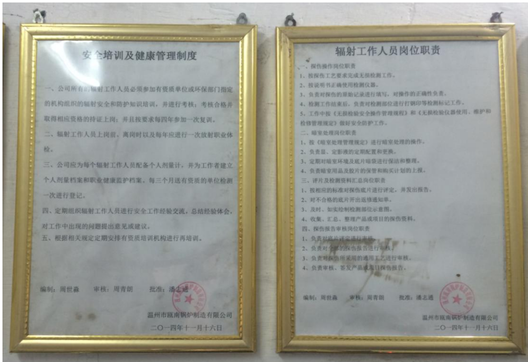
图 6-5 规章制度上墙明示