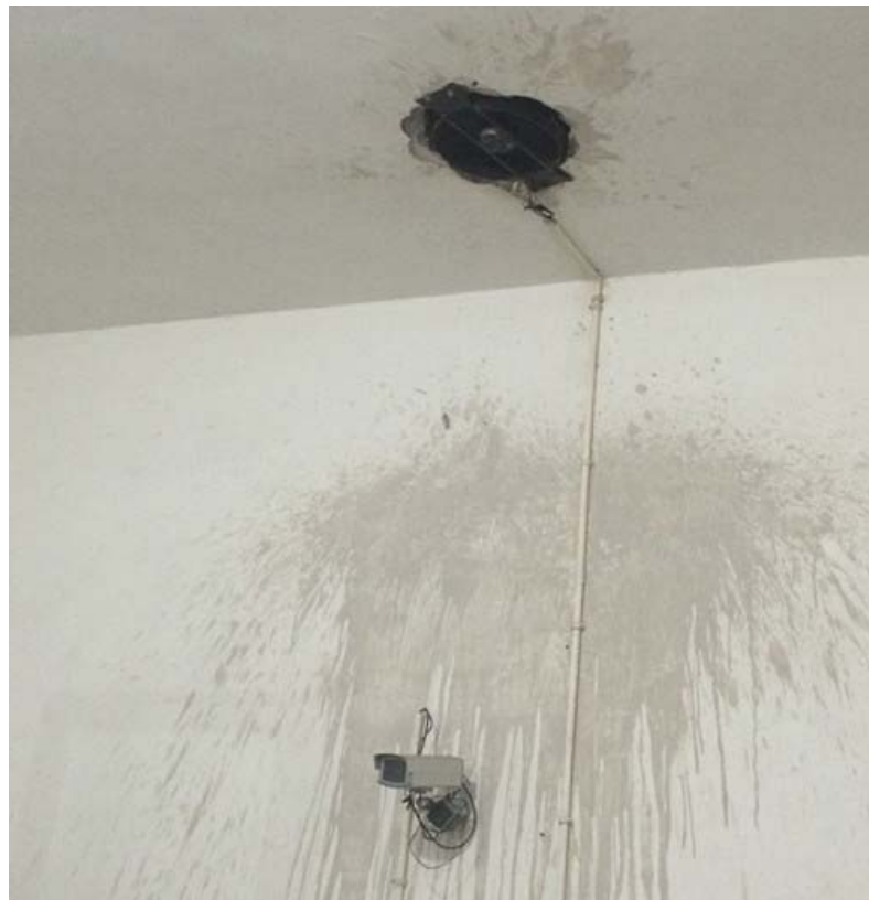
图 6-8 机械排风装置和监视摄像头