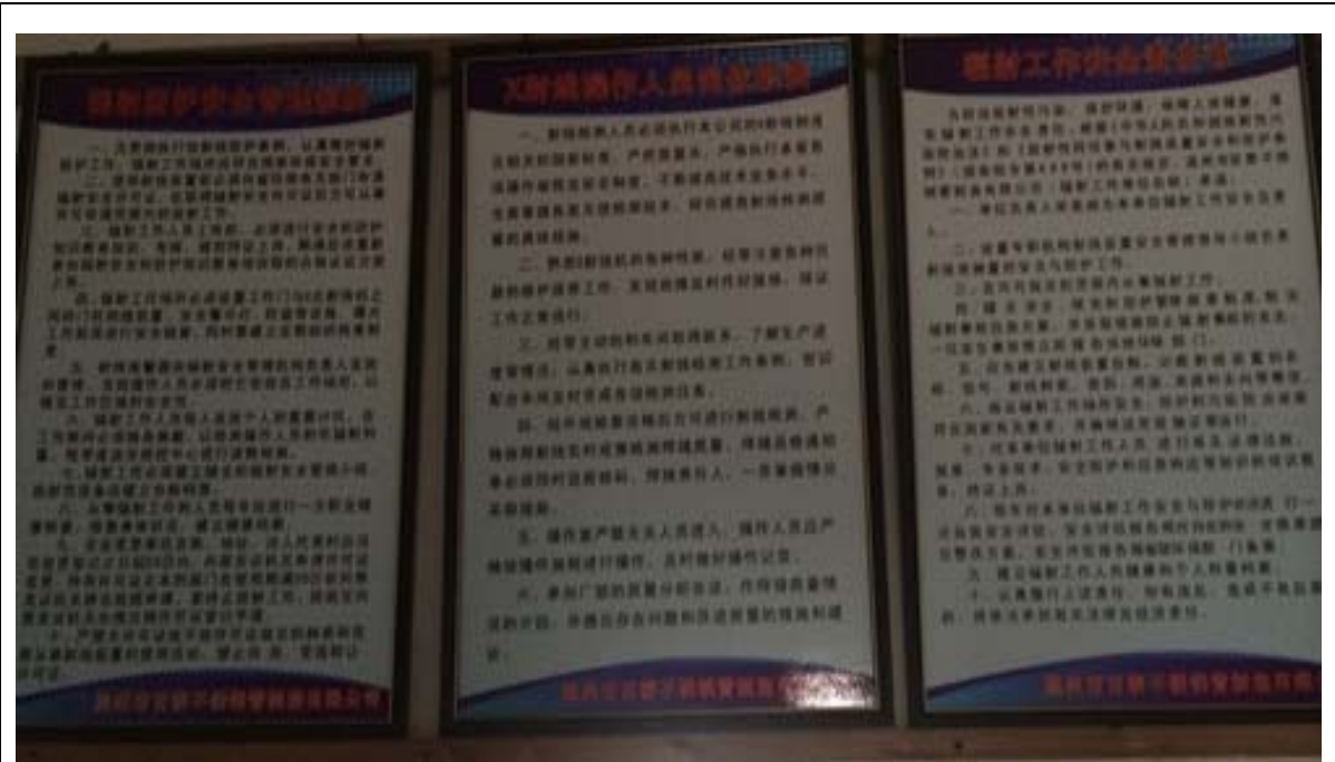
图 6-5 规章制度上墙明示