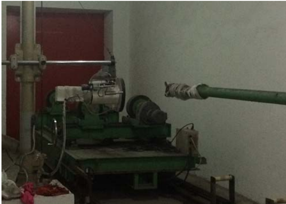
图 6-1 工业 X 射线探伤机