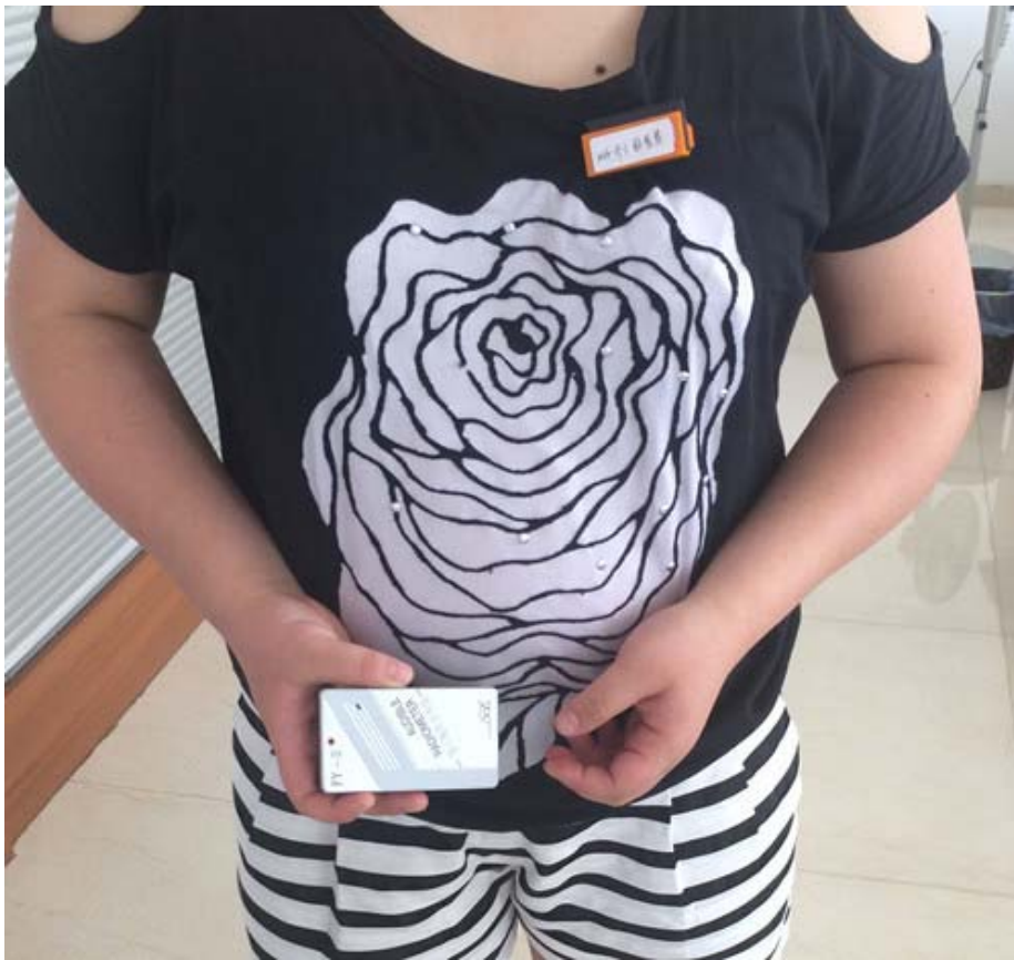
图 6-6 辐射工作人员佩戴个人剂量计，手持个人剂量报警仪