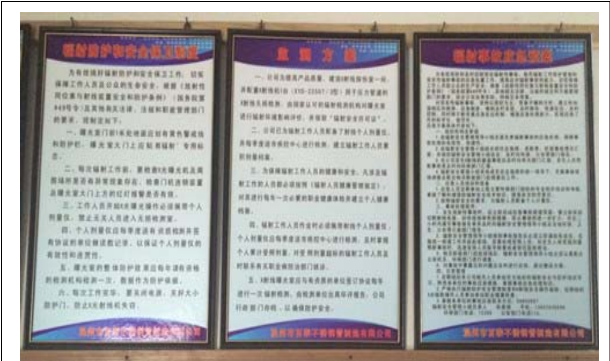
图 6-3 规章制度上墙明示