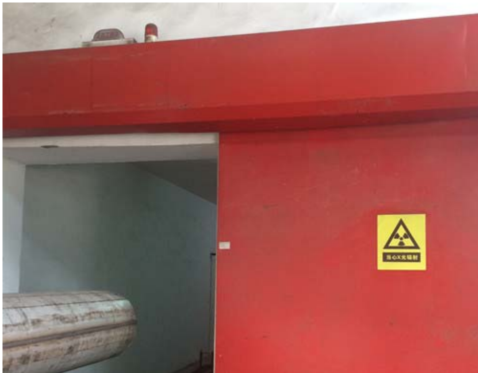
图 6-2 探伤室防护门、电离辐射标志及警示灯