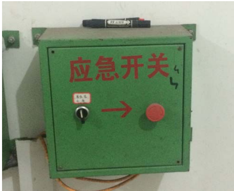
图 6-7 应急开关