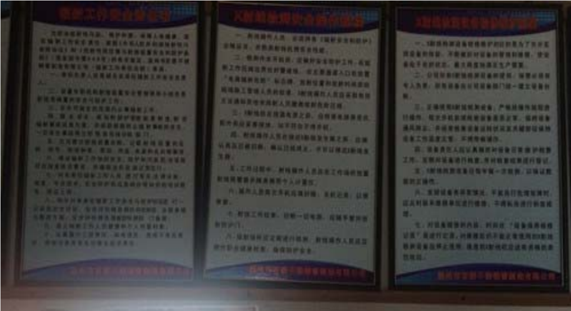
图 6-4 规章制度上墙明示