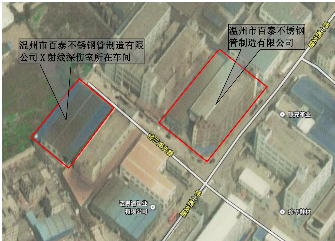
2-1 温州市百泰不锈钢管制造有限公司及探伤室地理位置示意图